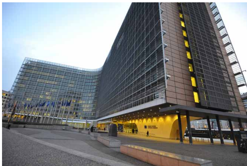
Berlaymont, Sitz der EU-Kommission in Brüssel

Den wahren Grund für die geforderten Schnellschüsse in der Nutzenbewertung kann man in den Papieren der Kommission finden. Da wird vor-