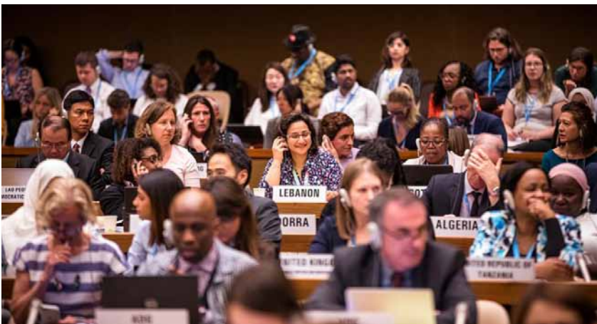
Abschließende Diskussion der Transparenzresolution bei der Weltgesundheitsversammlung am 28. Mai 2019

Die Geheimniskrämerei bei Medikamentenpreisen und klinischen Studien schadet PatientInnen weltweit. Sie behindert einen fairen Zugang zu Arzneimitteln ebenso wie den Zugang zu verlässlichen Informationen. Am 28. Mai hat die Weltgesundheitsversammlung (WHA) eine Resolution angenommen, die dem entgegenwirken möchte. Der deutlich ambitioniertere, ursprüngliche Entwurf ist jedoch massiv aufgeweicht worden. Deutschland blockierte besonders energisch und übte heftige Kritik am Verfahren.